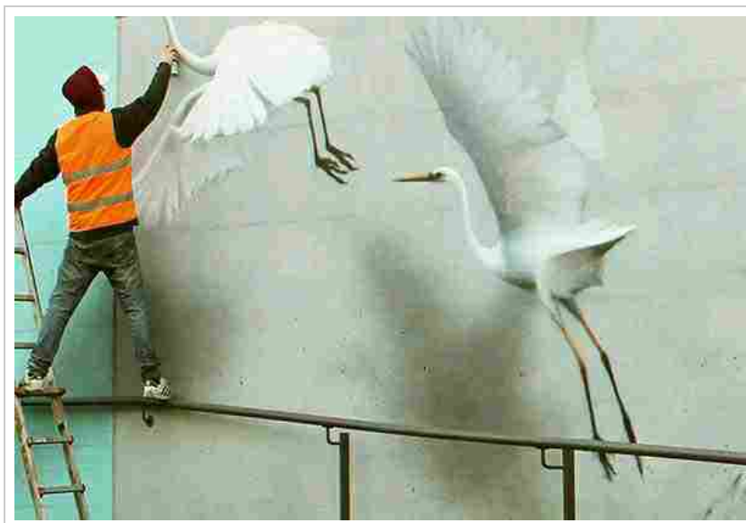
Eron, Riccione 2015

In occasione dei 2.200 anni dalla fondazione della città di Modena, l'artista, tra i più virtuosi interpreti della scena dell'arte urbana e della pittura contemporanea internazionale, realizzerà un murale dal titolo "Ad perpetuam rei memoriam"